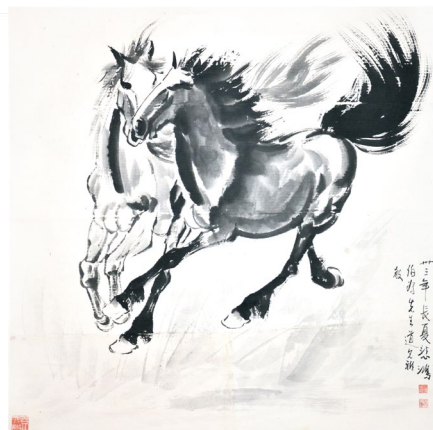
徐悲鴻(1895 - 1953)同赴天涯