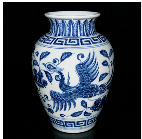
明宣德青花鳳穿花卉瓶

通體施黃釉，繪五彩九龍雲火紋戲珠，氣勢磅礴，尤為引人注目的是Lot 167，一對黃地五彩九龍雲火紋連蓋大梅瓶。瓶內素白，外壁繪龍呈綠色及茄色，周圍環繞雲火紋及如意紋。肩部攜(大清康熙年製)六字橫款，估價為$30,000-$40,000。