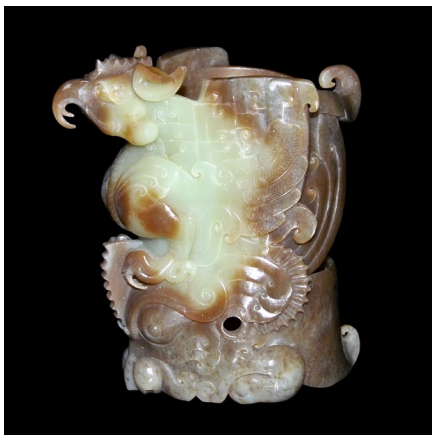
戰國稀有黃玉鏤雕靈鷲展翅獸首髮簪

精雕玉器的代表作品Lot 233，是一對痕都斯坦碧玉碗。呈半透明，碗壁薄如紙，紋飾流暢。碗外壁別地浮雕平展的茛苳花，花心錯落重迭，雕琢細膩，周圍繞一圈如意。整體極為精緻，充滿西域風格。該碗直徑15 cm，高6 cm，估價為$15,000-$30,000。