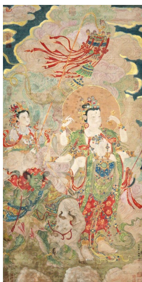
明仇英(1495 - 1552)朝元圖

被稱為元朝四家之首的黃公望(1269-1354)，其作品為Lot 102“雨後空林生白煙”。該畫上山岩掩映，樹木蔥茂，遠山如黛，並有房舍隱于樹林和霧氣迷濛之中，雨後空林、瀑布溪橋，山有處處流水潺潺流暢曲水，映帶左右而氣冠河山。此畫落款大癡道人，畫家鈐印一枚，且有收藏印十方，由文彭題字為天頭、項元汴題跋。其估價為$4,000,000-$6,000,000。