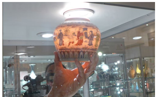
明成化粉紅胎開彩人物天字鈣罐

此外，文房用品的代表作為Lot 270，非常稀有的紀昀珽珽行素堂文房四寶漆方盒。盒呈長方形，漆胎，珽珽包鑲，紋理燦然。盒頂部刻詩，內有滑動層，底部中央刻(嘉慶年製)四字款，估價為$5,000-$8,000。