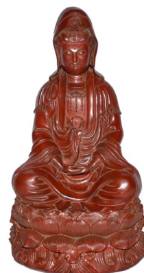
清乾隆朱漆布胎觀音坐蓮造像

Lot 97，齊白石的“貝葉昆蟲逐浪中”是一幅簡潔的作品，他用溫和的筆觸描繪了一隻昆蟲隨貝葉漂流，其上有蜻蜓縈繞。該畫由作者落款并攜鈐印兩枚，預期售價會達$50,000-$60,000。