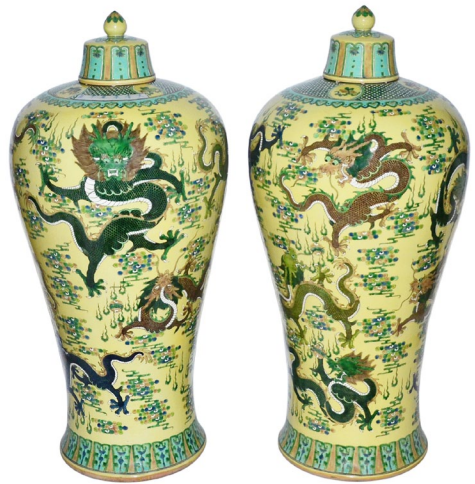
清康熙黃地五彩九龍雲火紋連蓋大梅瓶一對

漢代的玉器雕刻進一步體現了其神秘性，例如Lot 36，稀有的白玉雕鳳獸紋嵌寶觥。該器上端以高浮雕工法琢出三螭龍，下方琢出一挺立的鳳獸，觥身兩側鏤雕活環，並雕琢金絲卷雲紋，飾以寶石。底有刻款(建元)，預計售價$15,000-$30,000。Lot 24，白玉雕辟邪教子賞件，玉質致密溫潤，略帶黃紋，小獸依偎在母獸身邊，神情間似極眷戀母親。估價為$5,000-$8,000。Lot 143，白玉雕扭轉乾坤辟邪賞件。通體有褐色沁斑，辟邪回首作伏臥狀，圓目突出，張嘴呲牙，面露凶悍。其估價為$6,000-$8,000。