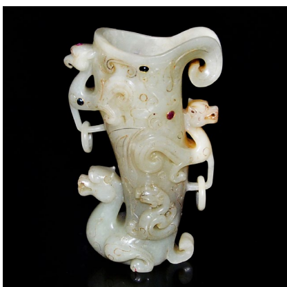
漢(武帝)白玉雕鳳獸紋活環嵌寶觥(建元)漢武帝刻款

中國的生肖動物、花卉以及神話中的生靈等元素都是本次貞觀拍賣中不可或缺的一部份。Lot 17是一個戰國時期的稀有黃玉鏤雕靈鷲髮簪，玉黃褐色，雕琢靈鳥展翅，外壁出戟，有兩個圓孔可以系繩或插髮簪。估價為$8,000-$15,000。Lot 273，是一個漢代的陶塑彩牛立像，以陶素製成，模製空心，全身飾紅白彩，卷雲紋。估價為$3,000-$5,000。