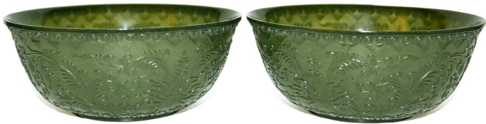
清痕都斯坦碧玉雕纏枝花卉紋碗(一對)

精雕玉器的代表作品Lot 233，是一對痕都斯坦碧玉碗。呈半透明，碗壁薄如紙，紋飾流暢。碗外壁別地浮雕平展的茛苳花，花心錯落重迭，雕琢細膩，周圍繞一圈如意。整體極為精緻，充滿西域風格。該碗直徑15 cm，高6 cm，估價為$15,000-$30,000。